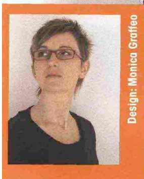
Design: Monica Graffeo